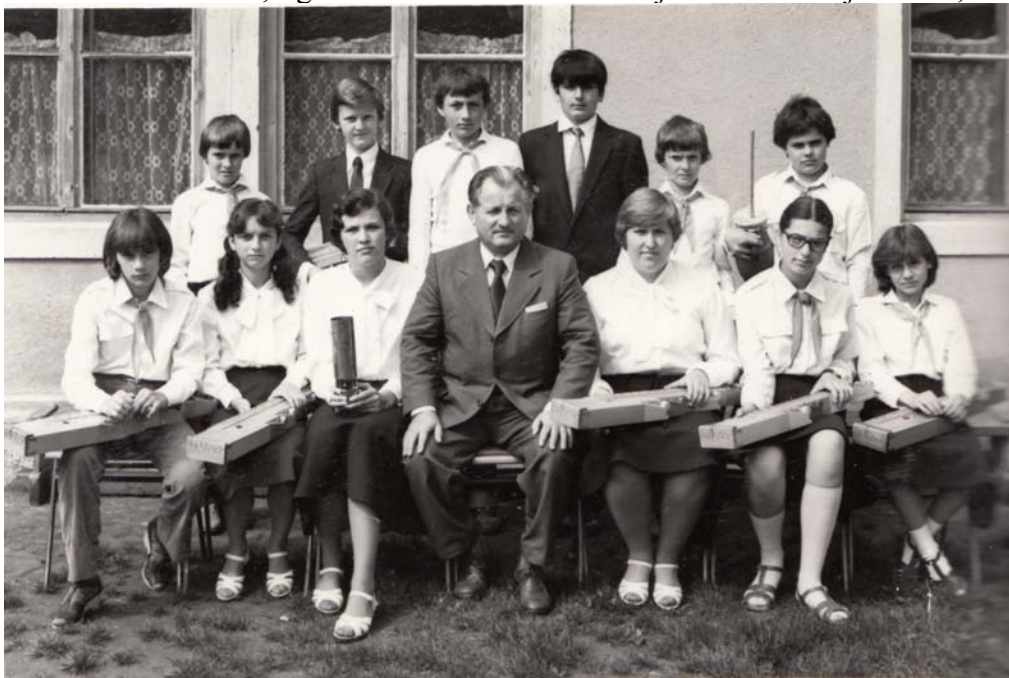
Fotó: A citerazenekarral 1982-ben

Feladataimat, melyet az élet elém szabott, elvégeztem-e? E gondolat végigkísért. Kétségtelenül hatalmas segítséget, erőt jelentett az a millió gyökér és emberi kapcsolat, mely összefűzött a munkahelyemmel, a faluval. Mindig éreztem, hogy amit csinálok, az a szülőföldért, Nagysimonyiért, a jövőért teszem. Nagy öröm volt számomra a citerazenekar megszervezése, újjáteremteni a majd elfelejtett népi muzsikát. Sikerült átmenteni, - gondolom a sok citerázó majdan tovább adja fiának, unokájának.