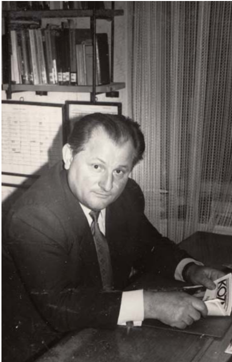
Fotó: Az igazgatói irodában 1978-ban.

Aztán az élet igazolta e téves oktatáspolitikai elképzelést: élnek a nagyobb községek iskolái! Mert, ha a községben az iskola megszűnik, nincs ott pedagógus, visszasüllyed sok minden a feudális állapotokba.