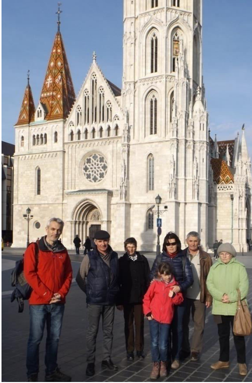
Mátyás templom előtt