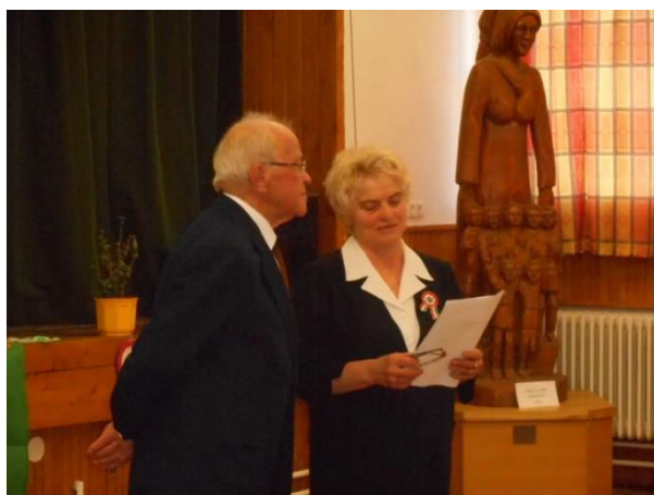
A képzállítás megnyitóján