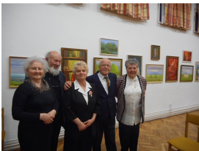
Vendégek a kiállításon