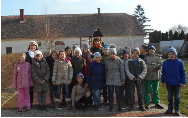
A 3. B. a Játsszótéren

Márc. 19-én Koncert várta a fiatalokat és a zenét kedvelőket. Fellépett: a Katapult, a Pandorra és a Csabigél együttes. Tehetséges, ügyes zenészek mutatkoztak be a színpadon, a hallgatóság, a fiatalok nagyon jól szórakoztak!