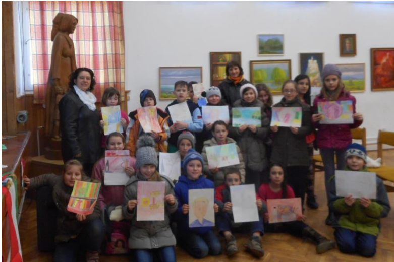
A Szent Benedek Katolikus Általános Iskola 3. B. osztályosai

Márc. 17-én rendhagyó rajz órát szerveztünk a celldömölki Szent Benedek Katolikus Általános Iskola 3. B. osztályos tanulói részére. A tárlatvezetés után a gyerekek választottak maguknak egy kedvenc festményt és azt megörökítették. Az elkészítés után „mini kiállításon” mutatták be az elkészült „remekműveket”. Majd Ki mit tud? következett, a színpadon szerepeltek a bátor kis előadók. Egyéni tánc, csoportos tánc, egyéni - közös szavalatok váltogatták egymást. Jó hangulatú, közösség építés volt ez a délután. A szép tavaszi napon a maradék időben birtokba vettük a Játszóteret is.