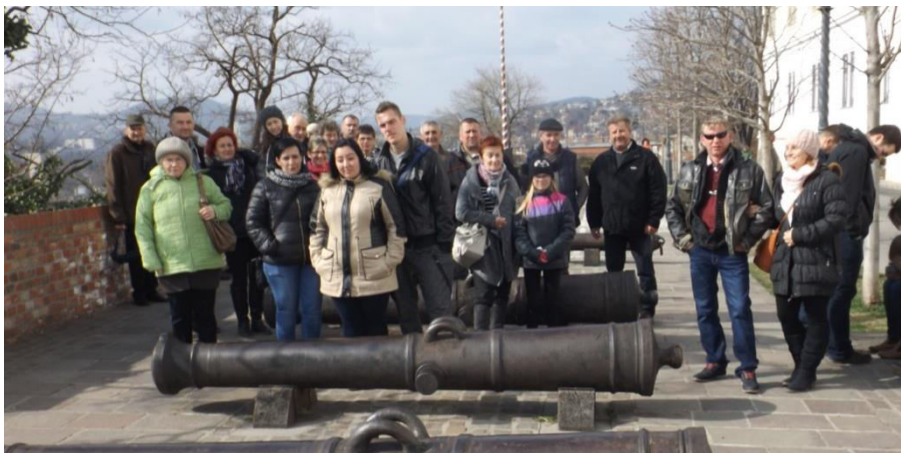
Hadtörténeti Múzeum ágyúinál