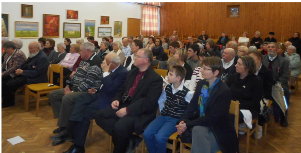
Az ünneplő közönség