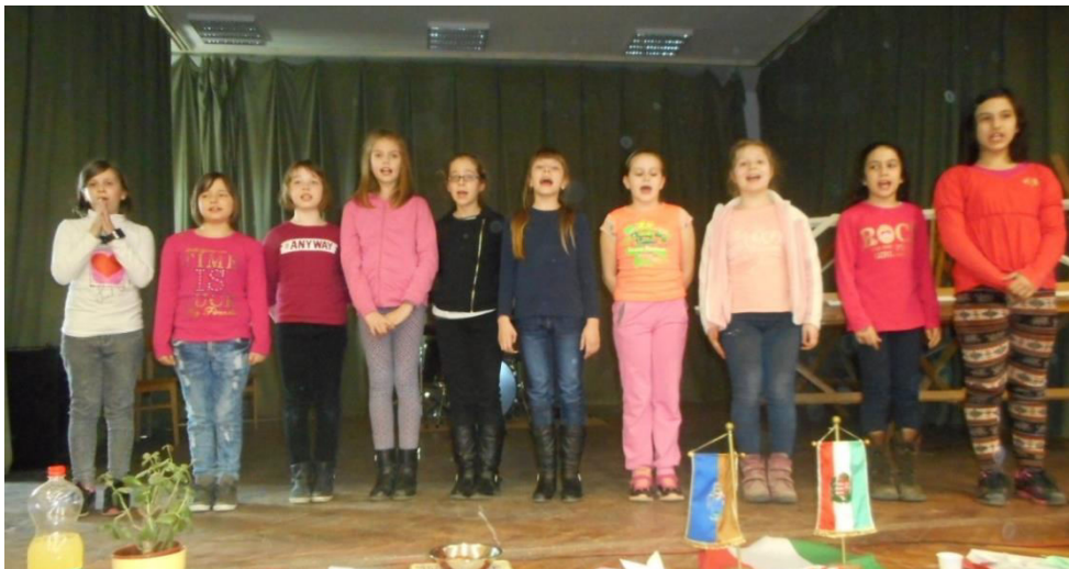
Ki mit tud? a színpadon