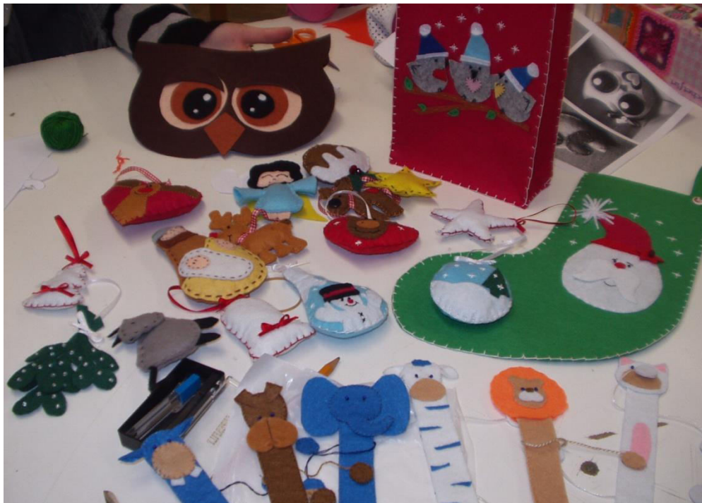
Ügyes, kreatív díszek a szakkör tagjaitól