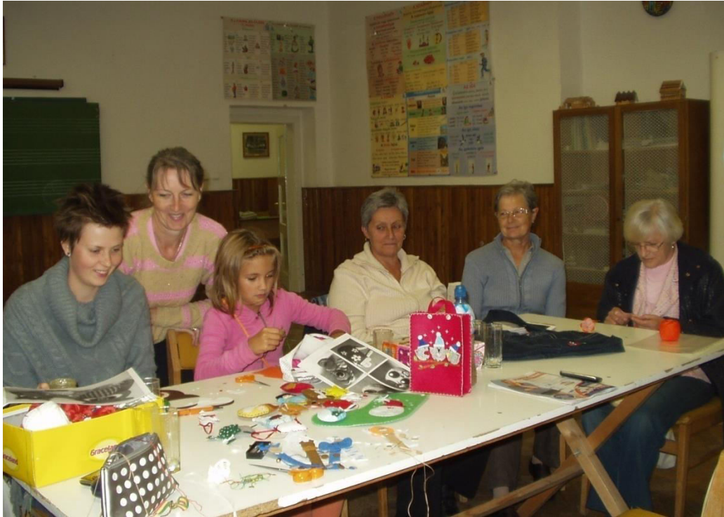
A Kézimunkaszakkör tagjai munka közben